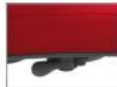
Regulação de altura por elevação a gás