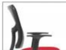
Oscilação da costa em 11°